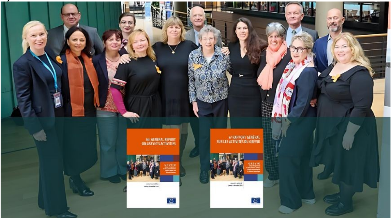
Shrinking space for women's rights defenders