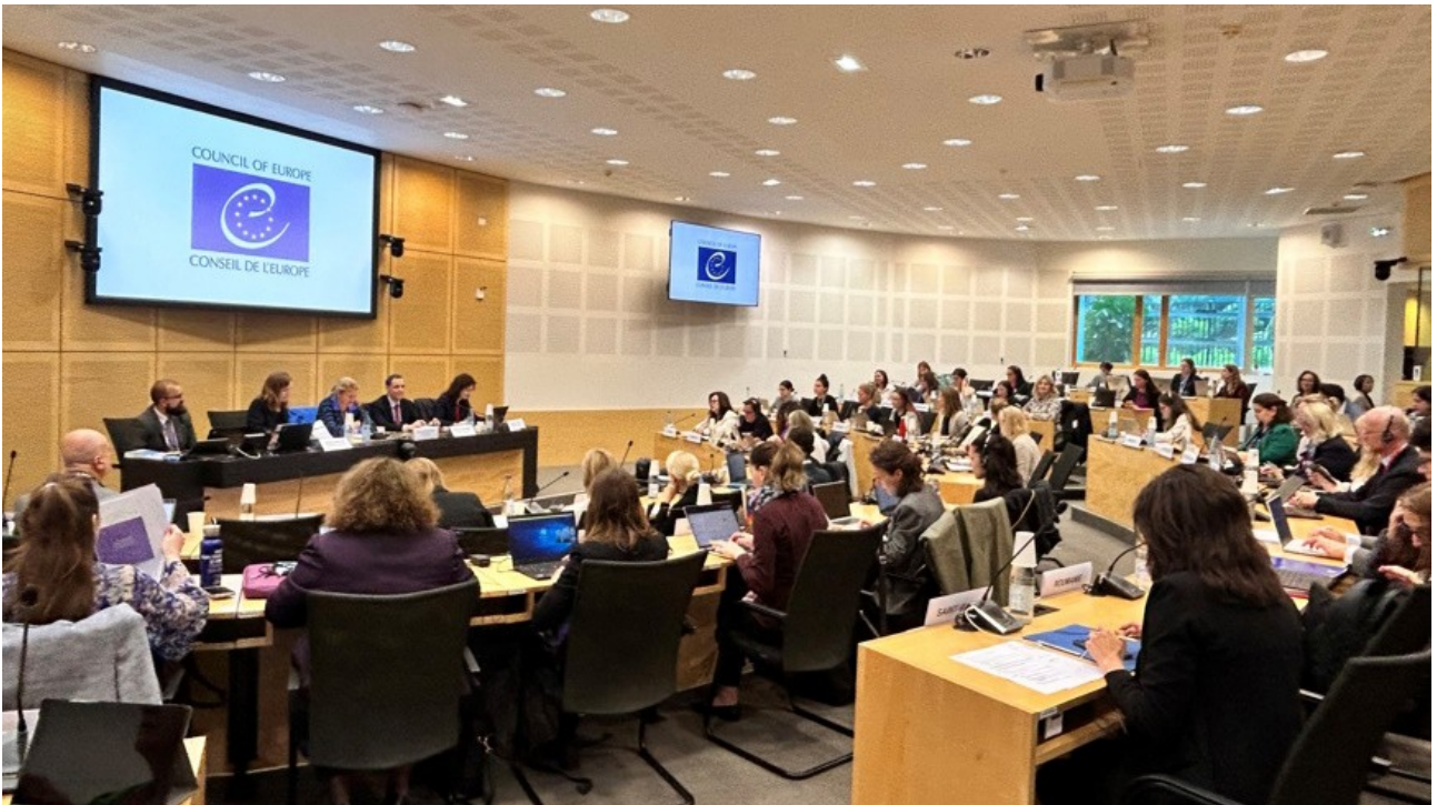
Revision of Rule of Procedure